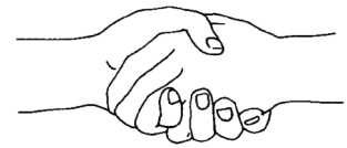
Aperto de mão escutista