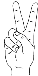
Saudação do Lobito: posição dos dedos