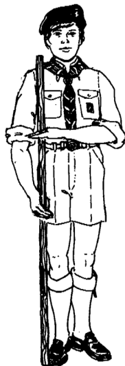
Saudação com vara

Faz-se, quando uniformizado e transportando vara, cruzando o antebraço esquerdo horizontalmente à frente do peito, tocando com os dedos em saudação a vara que deve estar vertical, paralela ao lado direito do corpo, segura com o braço estendido e encostada a meio do pé direito.